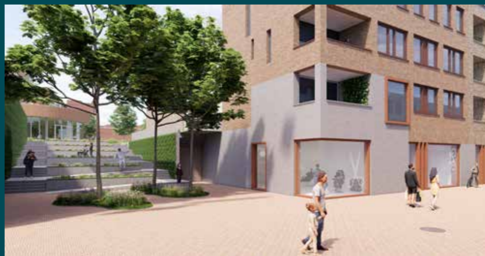
Doorsteek van de Kerkstraat naar het Victoriapark