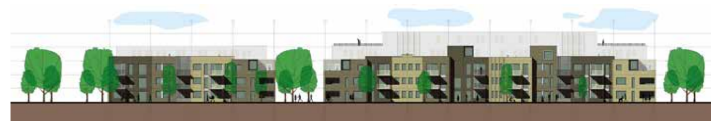
Gevel zijde Victoriapark

~ Richard Wagner van Grouwels Daelmans Projectontwikkeling BV